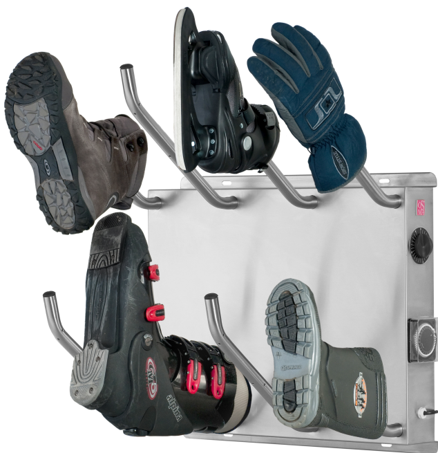
Ausführung family4 für 4 Paar Schuhe und Stiefel