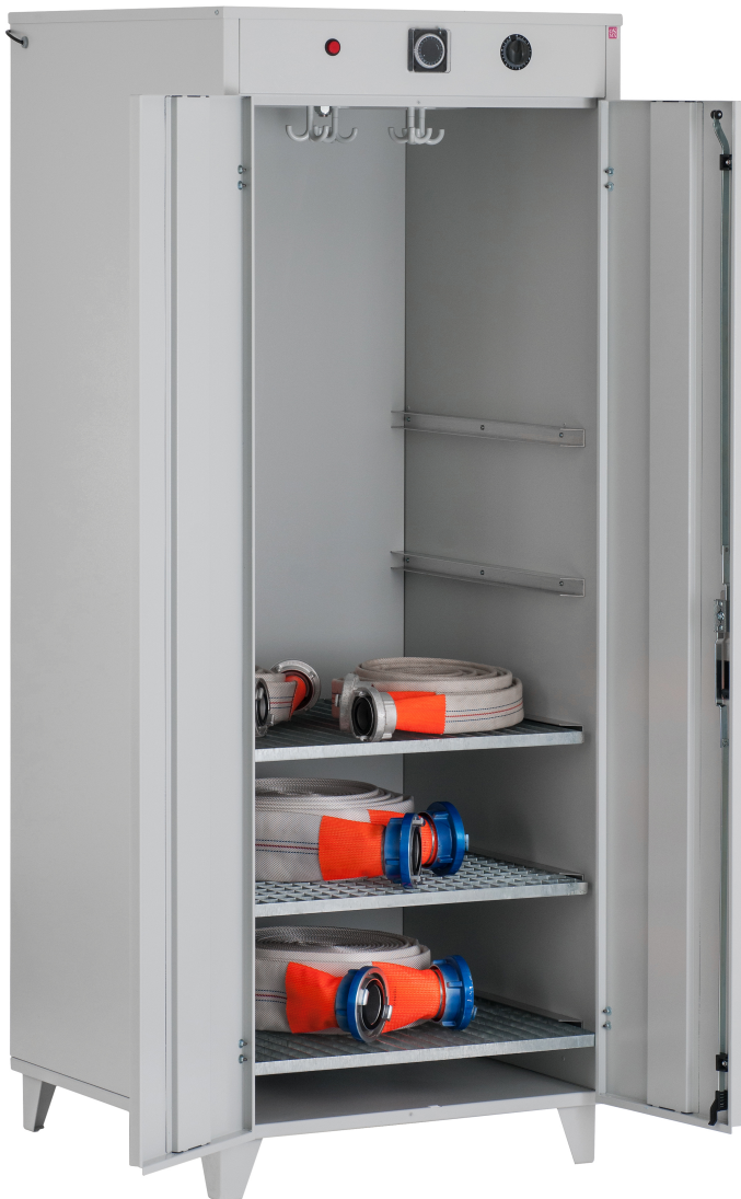
Ausführung STS 900 mit 5 Schienen und 3 Gitterrosten

Zweitüriger Schlauch- und Bekleidungstrockenschrank aus Stahlblech zum Trocknen aller Typen von Druckschläuchen und Bekleidungen inklusive Führungsschienen zur Aufnahme von bis zu 7 Gitterrosten. Desweiteren ist der STS mit einem Drehteller mit 18 Haken zum Aufhängen von Bekleidung ausgestattet.