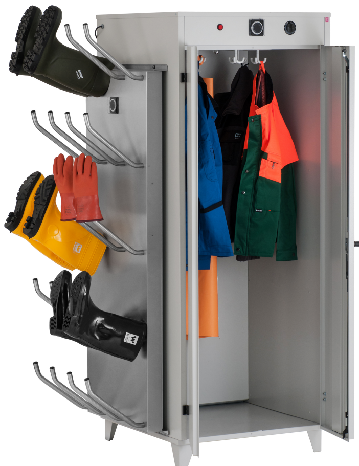
Ausführung KTS 2000 inklusive Blow 10 Schuhrockner links montiert

Für 20 Paar Schuhe und Stiefel: Zwei Blow 10 links und rechts montiert.